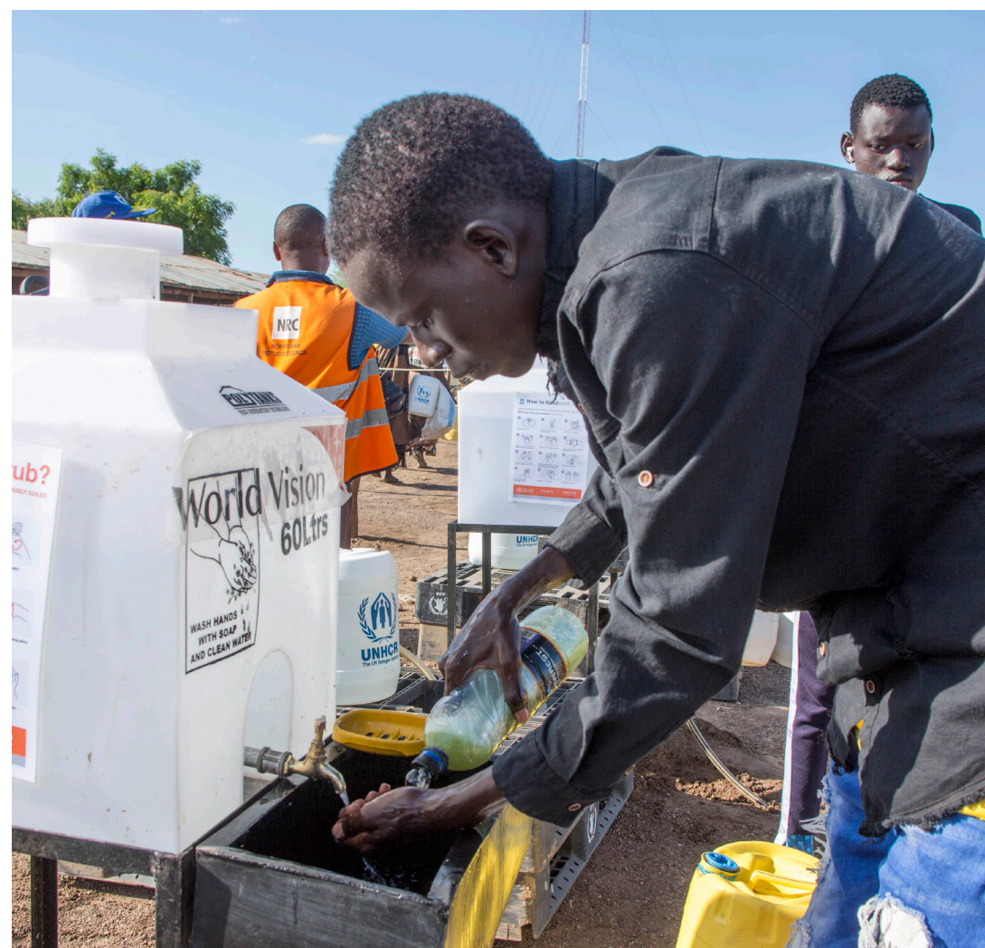
World Vision Kenya fait la promotion des pratiques d'hygiène recommandées et des mesures de distanciation sociale tout en distribuant de la nourriture pour améliorer le bien-être des enfants et des familles au camp de réfugiés de Kakuma.