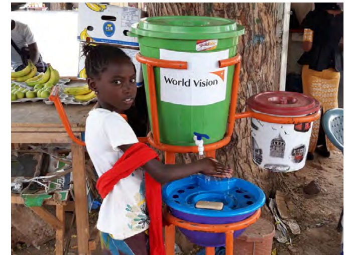
Dans la réponse de Vision Mondiale au Sénégal à COVID-19, les enfants sont au centre de la réponse.