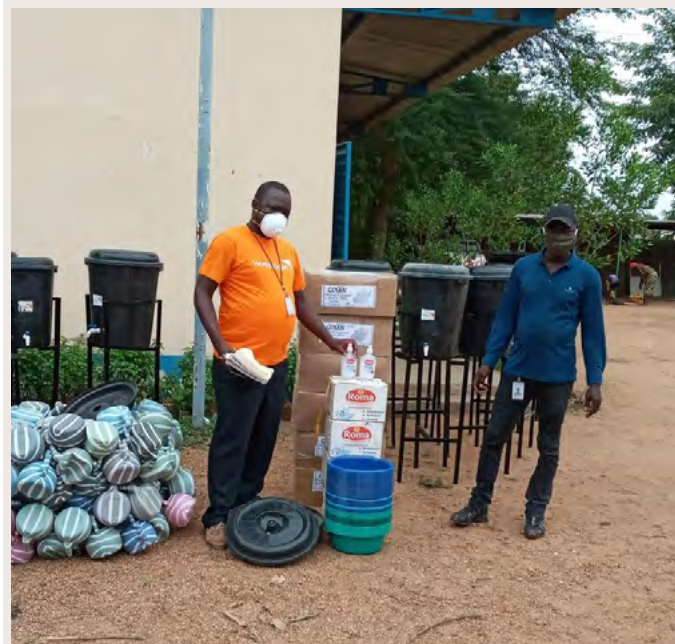
World Vision Chad fait don de matériel de prévention du COVID-19 pour une utilisation dans 38 centres de santé dans quatre districts