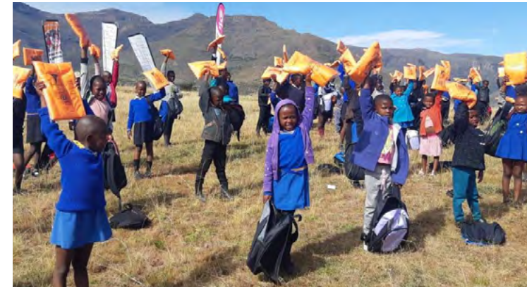
World Vision Lesotho a fourni aux élèves de l'école primaire de Ntjepeleng des informations sur le COVID-19, les précautions et kits d'hygiène personnels.