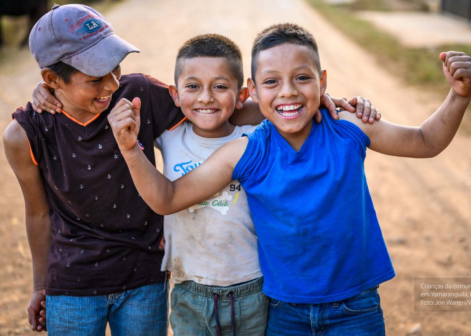
Crianças da comunidade El Cerron, em Yamaranguila, Honduras.

Nossa visão para todas as crianças é vida em abundância. Nossa oração para todos os corações é a vontade para tornar isso uma realidade.