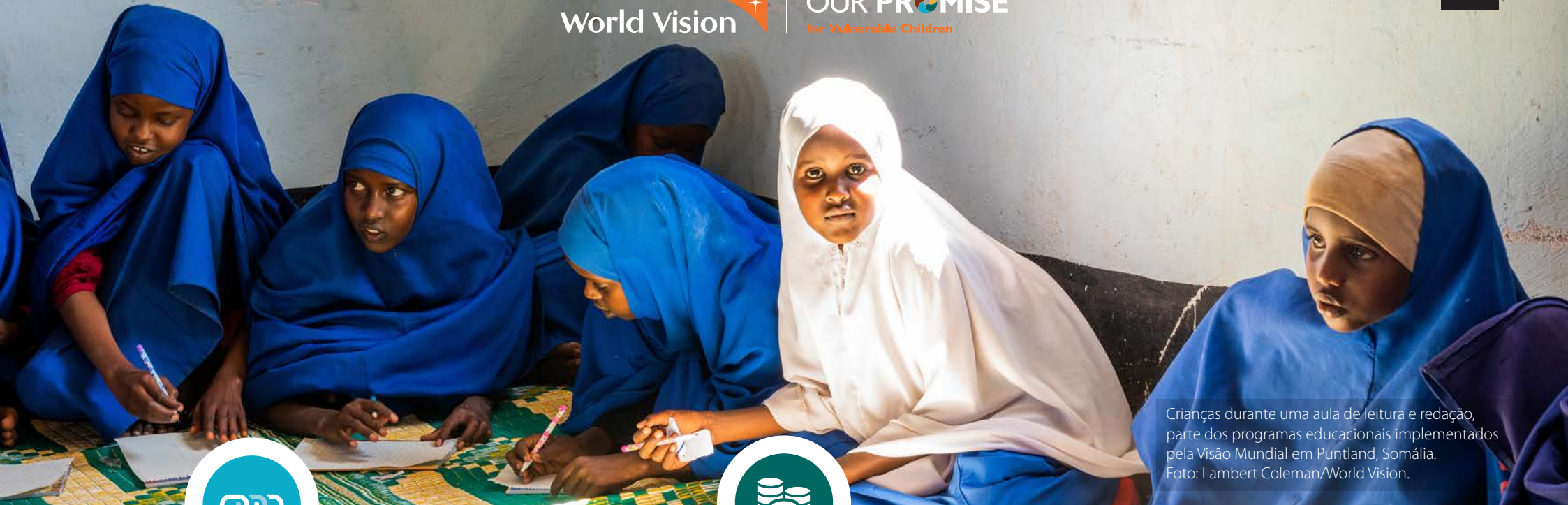
Crianças durante uma aula de leitura e redação, parte dos programas educacionais implementados pela Visão Mundial em Puntland, Somália.